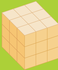
*立体図形はイメージサイズ